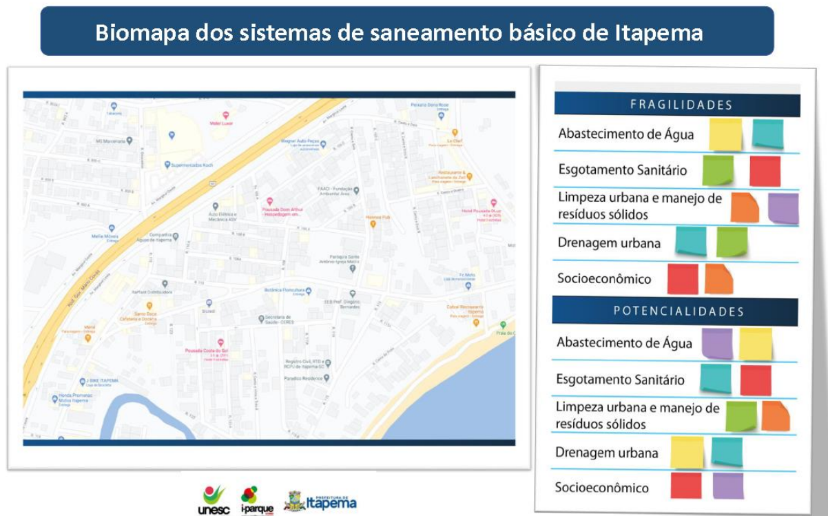
Figura 5 - Modelo de biomapa.

Ao final do processo de construção do biomapa cada grupo apresentará a todos os participantes as principais fragilidades e potencialidades elencadas, de forma a universalizar a percepção observada da realidade do município nos eixos do saneamento.