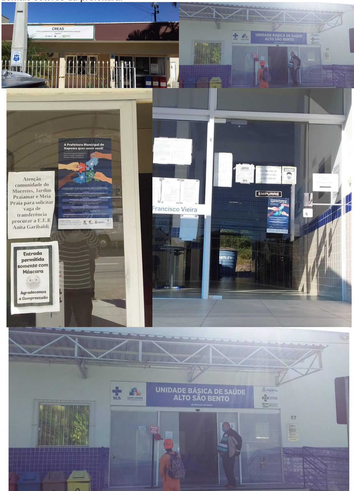
Figura 9 - Registro fotográfico de cartazes distribuídos nas unidades de saúde e demais setores da prefeitura.