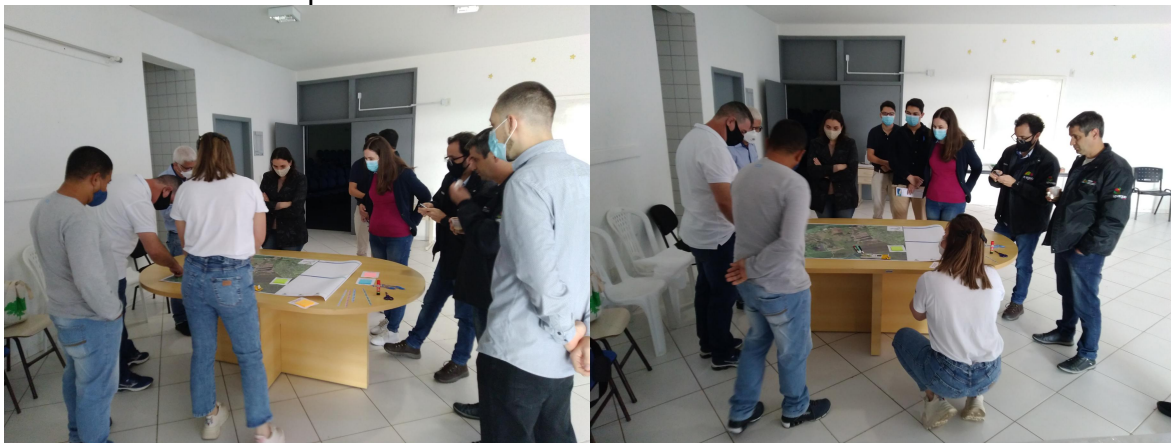
Figura 20 - Público participante da terceira Reunião de Bairro em 24 de julho de 2021 na Escola Municipal Paulo Reis.