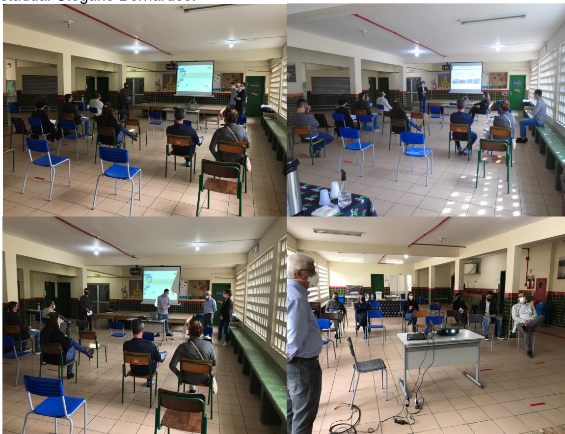
Figura 25 - Registros da sexta Reunião de Bairro em 7 de agosto de 2021 na Escola Estadual Olegário Bernardes.