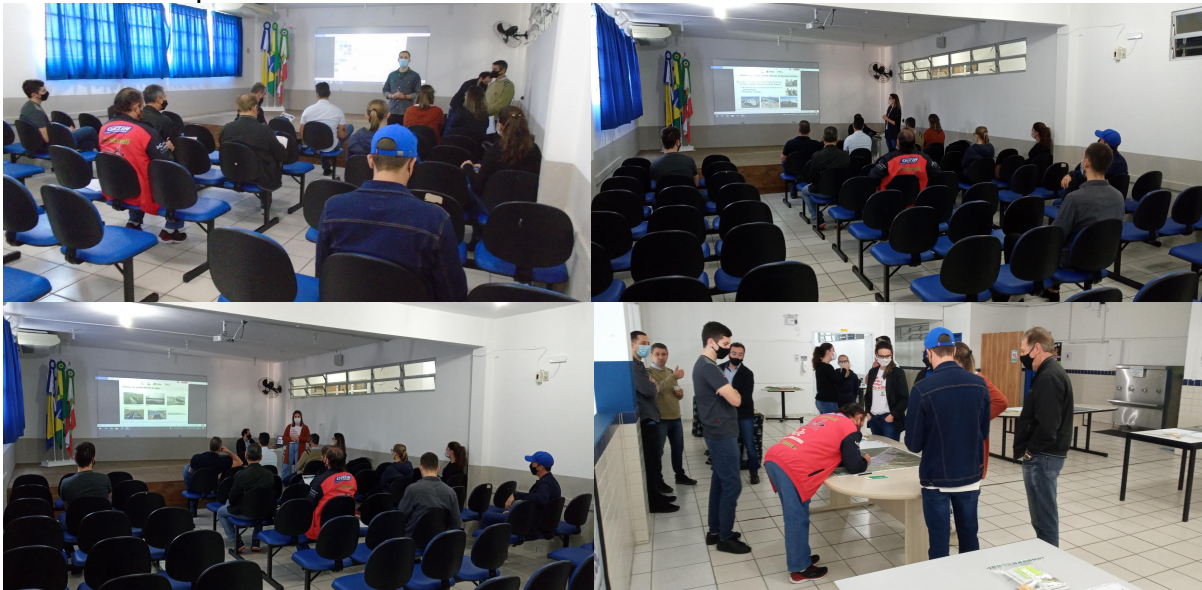
Figura 15 - Registros da primeira Reunião de Bairro em 10 de julho de 2021 na Escola Municipal Educuar.