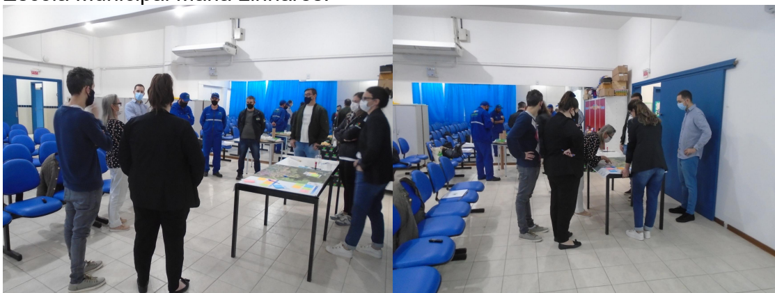
Figura 24 - Público participante da quinta Reunião de Bairro em 7 de agosto de 2021 na Escola Municipal Maria Linhares.