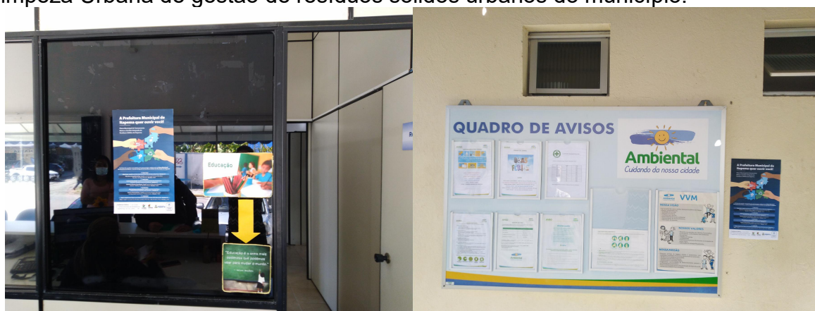
Figura 5 - Cartazes entregues na Secretaria de Educação e na empresa Ambiental Limpeza Urbana de gestão de resíduos sólidos urbanos do município.

Na Figura 5 constam algumas das fotos registradas nos estabelecimentos com intuito de mobilização social.