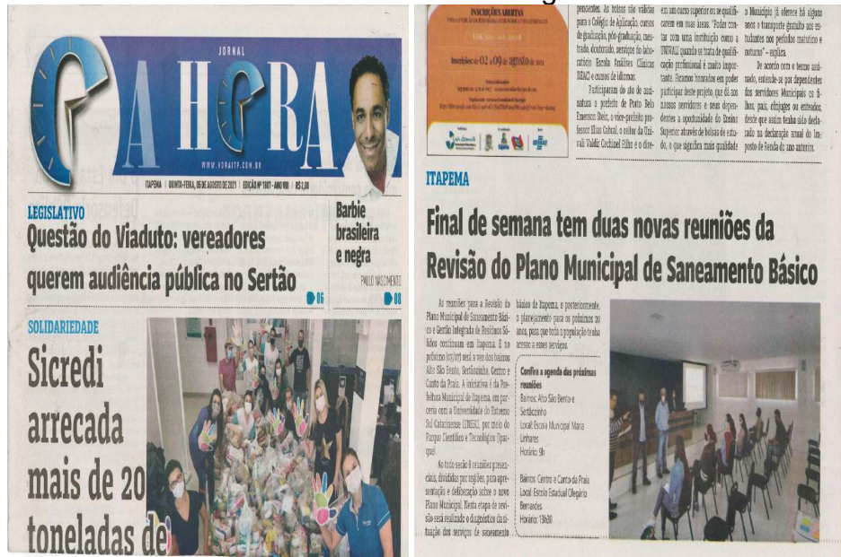
Figura 13 - Registro de recorte de matérias de jornais de circulação regional divulgando as reuniões de bairro datadas de 7 de agosto de 2021.