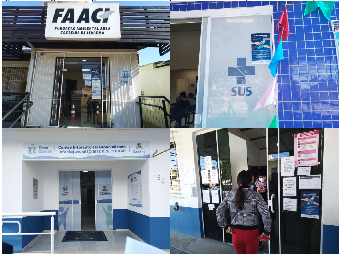
Figura 6 - Registro fotográfico da mobilização em setores da prefeitura municipal.

As Figura 6 e 7 ilustram as fotos registradas dos estabelecimentos e setores do município de Itapema com intuito da mobilização social para a participação nas reuniões de bairro.