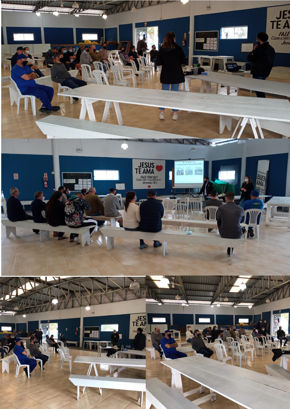
Figura 29 - Registros da oitava Reunião de Bairro em 14 de agosto de 2021 na Associação dos Moradores.

As Figuras 29 e 30 evidenciam a condução da oitava Reunião de Bairro na Associação dos Moradores do Bairro Ilhota.