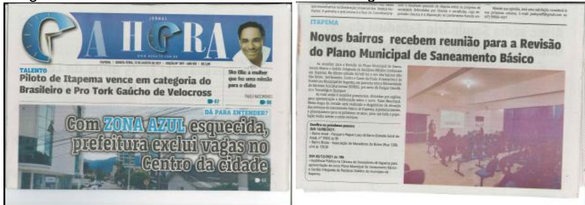
Figura 14 - Registro de recorte de matérias de jornais de circulação regional divulgando as reuniões de bairro datadas de 14 de agosto de 2021.