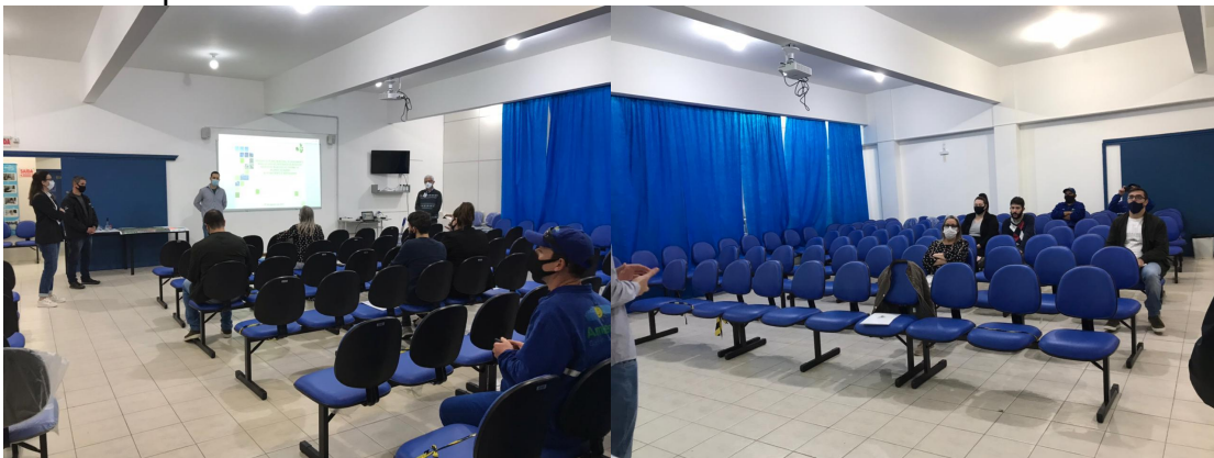
Figura 23 - Registros da quinta Reunião de Bairro em 7 de agosto de 2021 na Escola Municipal Maria Linhares.

As Figuras 23 e 24 evidenciam a condução da 5ª Reunião de Bairro na Escola Municipal Maria Linhares, situada no bairro Alto São Bento.