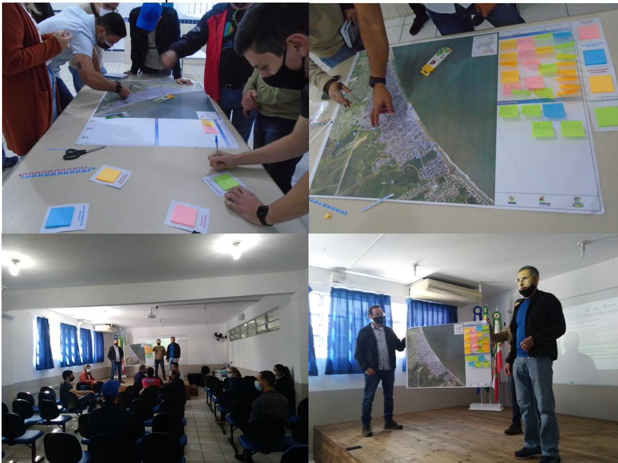
Figura 16 - Público participante da primeira Reunião de Bairro em 10 de julho de 2021 na Escola Municipal Educuar.