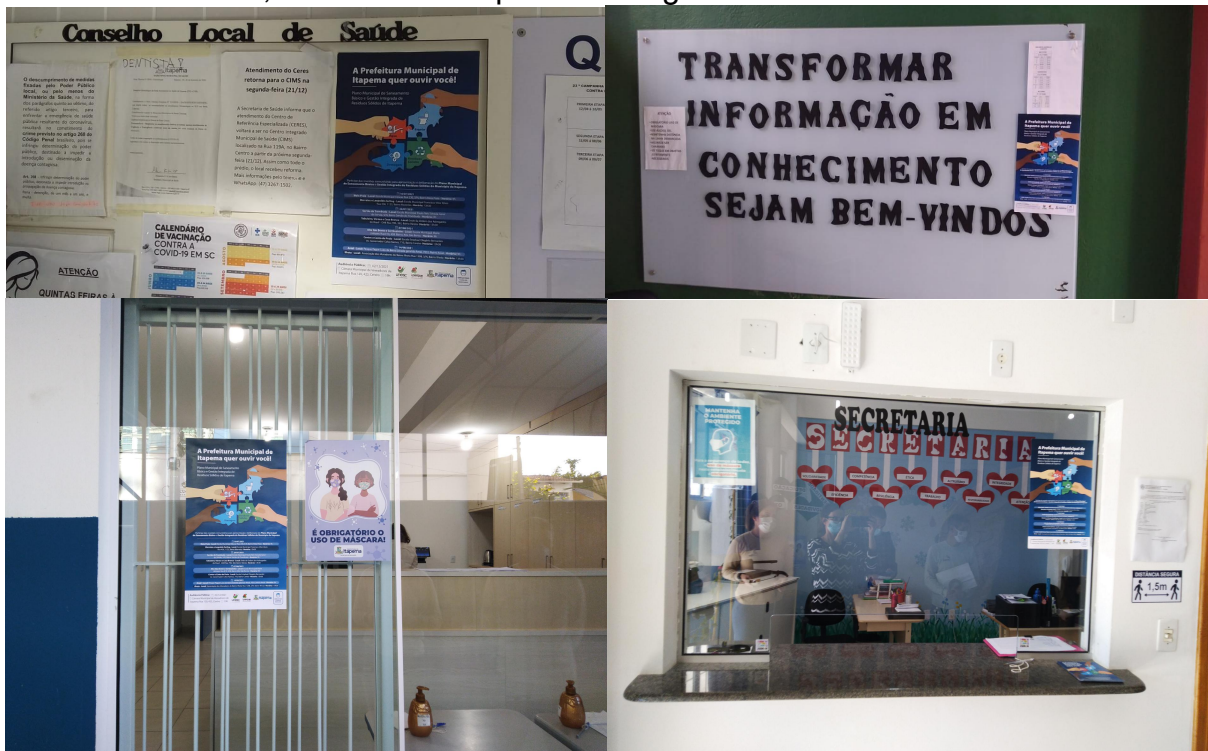
Figura 3 - Registro fotográfico da mobilização nas escolas e estabelecimentos nos bairros Meia Praia, Morretes e Leopoldo Zaring.

Nessa mesma data, foram entregues 40 convites na sede da Prefeitura Municipal de Itapema nos setores de IPTU e ITBI, além da colagem de dois cartazes. A Figura 3 ilustra algumas das fotos registradas nos estabelecimentos e setores com intuito de mobilização social.