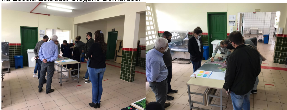
Figura 26 - Público participante da sexta Reunião de Bairro em 7 de agosto de 2021 na Escola Estadual Olegário Bernardes.