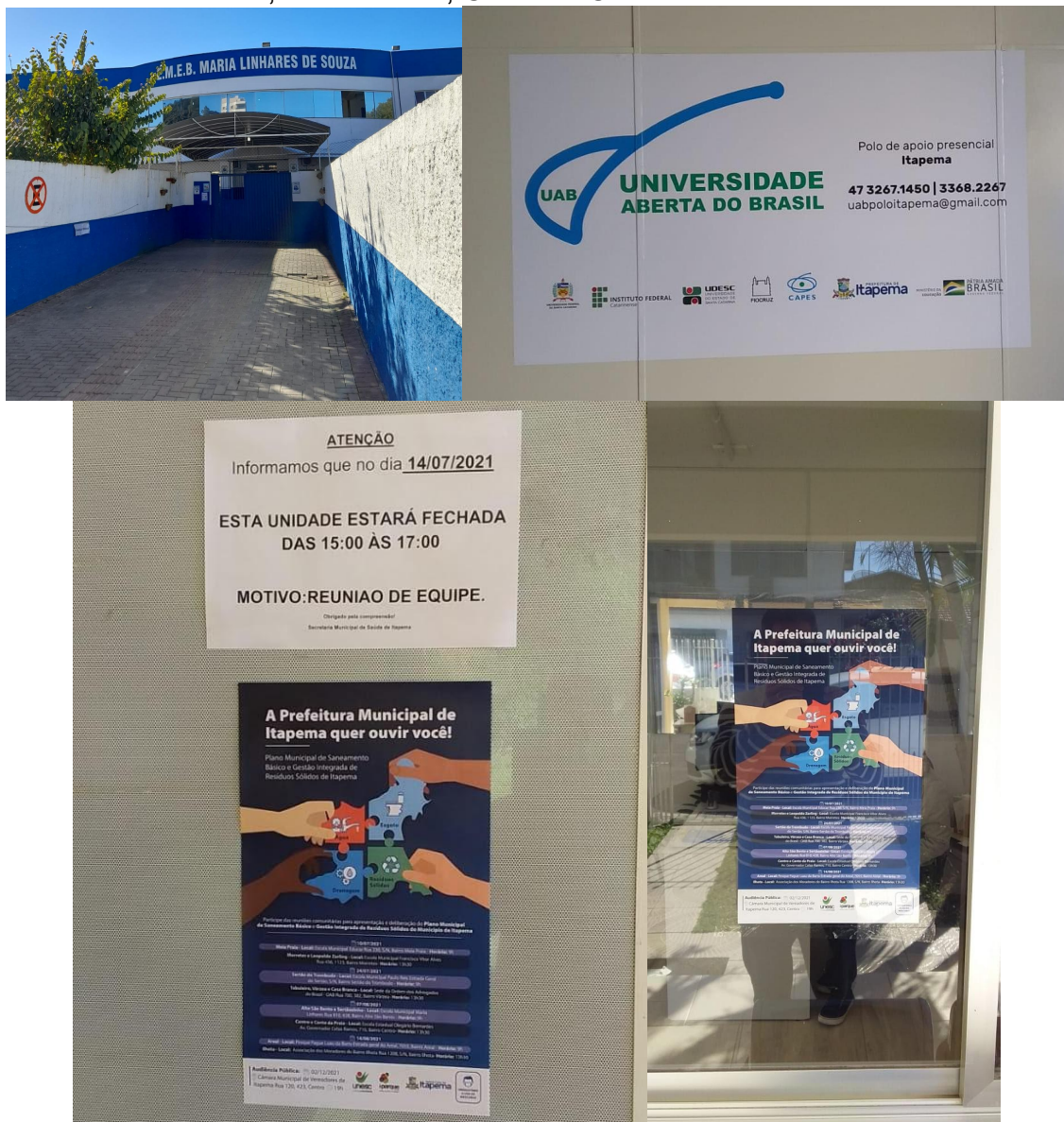
Figura 8 - Registro fotográfico da mobilização em escolas e unidades de saúde nos bairros Alto São Bento, Sertãozinho, Centro e Canto da Praia.

Nessa mesma data, foi realizada a colagem de vários cartazes nas Unidades de Saúde, CREAS (Centro de Referência Especializado de Assistência Técnica) e Associação de Moradores. Também foi entregue na recepção da Câmara de Vereadores 13 cartazes, uma para cada vereador visando motivá-los a mobilização e participação nas reuniões de bairro. As Figuras 8 e 9 ilustram os estabelecimentos e setores onde foram feitas a colagem de cartazes para a mobilização social.