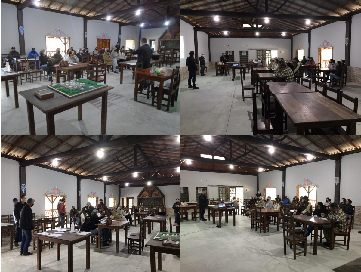
Figura 27 - Registros da sétima Reunião de Bairro em 14 de agosto de 2021 no Pesque Pague Luau da Barra.