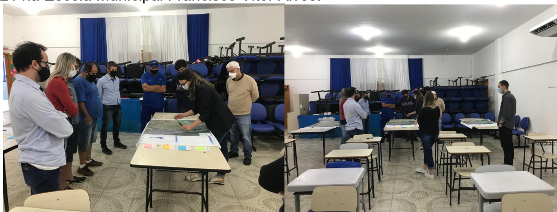
Figura 18 - Público participante da segunda Reunião de Bairro em 10 de julho de 2021 na Escola Municipal Francisco Vitor Alves.