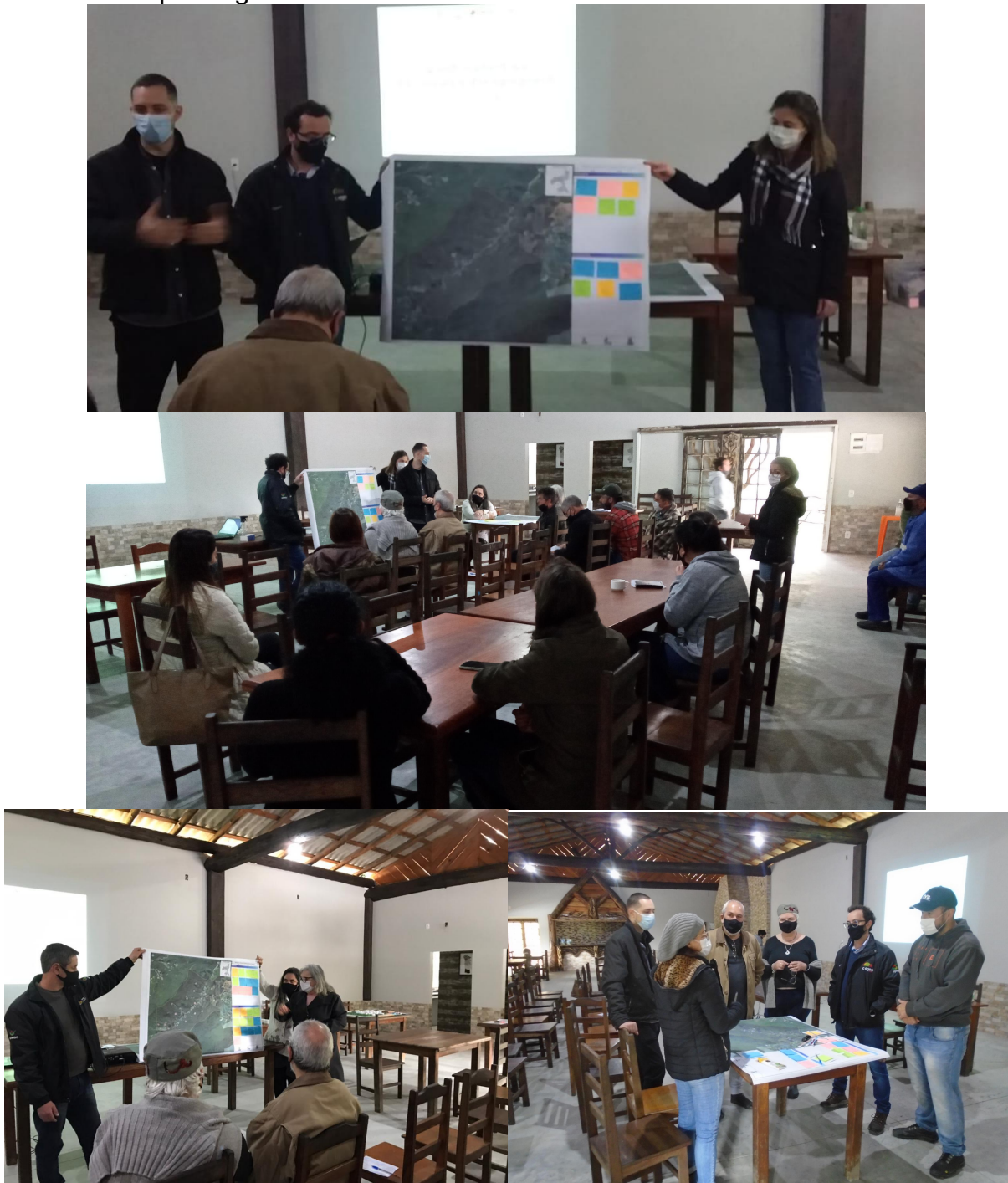
Figura 28 - Público participante da sétima Reunião de Bairro em 14 de agosto de 2021 no Pesque Pague Luau da Barra.