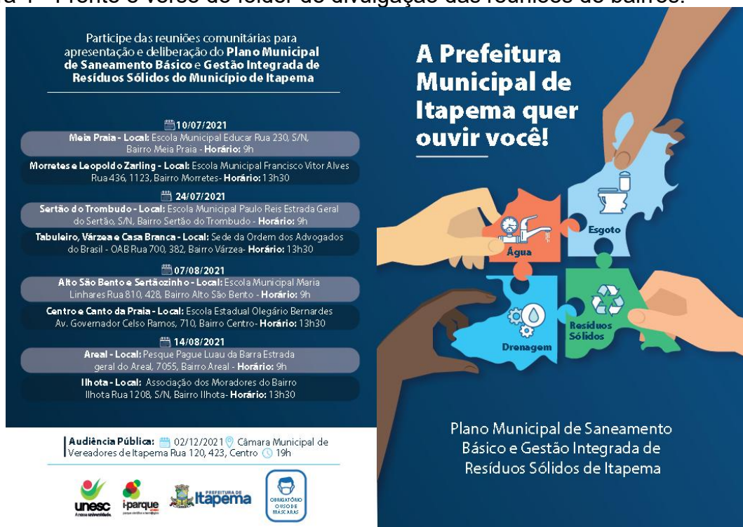
Figura 1 - Frente e verso do folder de divulgação das reuniões de bairros.

As Figuras 1 e 2 ilustram a configuração do folder e convite confeccionados para a divulgação das reuniões de bairro.