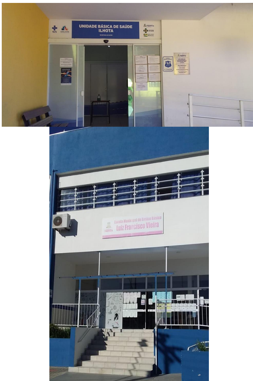
Figura 10 - Colagem de cartaz na unidade de saúde e na escola municipal no bairro Ilhota.

Em 19 de julho de 2021 foi dada a continuidade na visita junto às escolas e setores do município de Itapema, sendo entregues 143 convites e colagem de vários cartazes: 62 convites e um cartaz na Escola Municipal Luiz Francisco Vieira, 40 convites na FAACI e 41 convites na sede da Administração da Prefeitura Municipal (Figura 10).