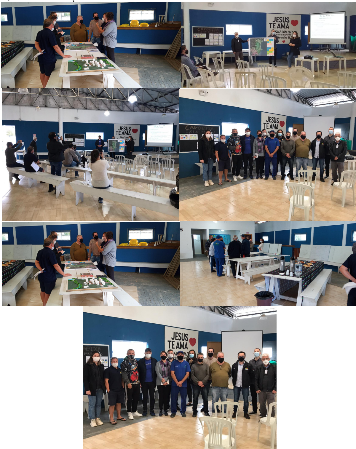
Figura 30 - Público participante da oitava Reunião de Bairro em 14 de agosto de 2021 na Associação de Moradores.