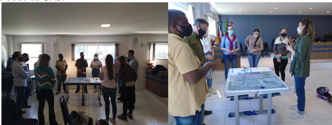
Figura 22 - Público participante da quarta Reunião de Bairro em 24 de julho de 2021 na Sede da OAB.