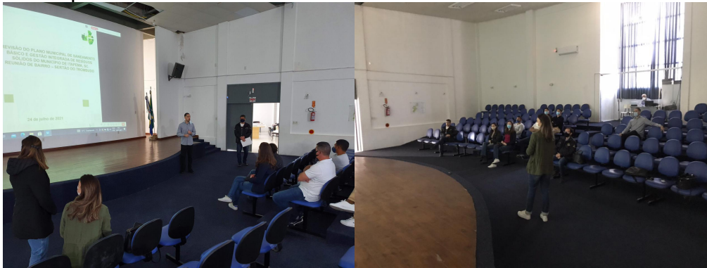
Figura 19 - Registros da terceira Reunião de Bairro em 24 de julho de 2021 na Escola Municipal Paulo Reis.