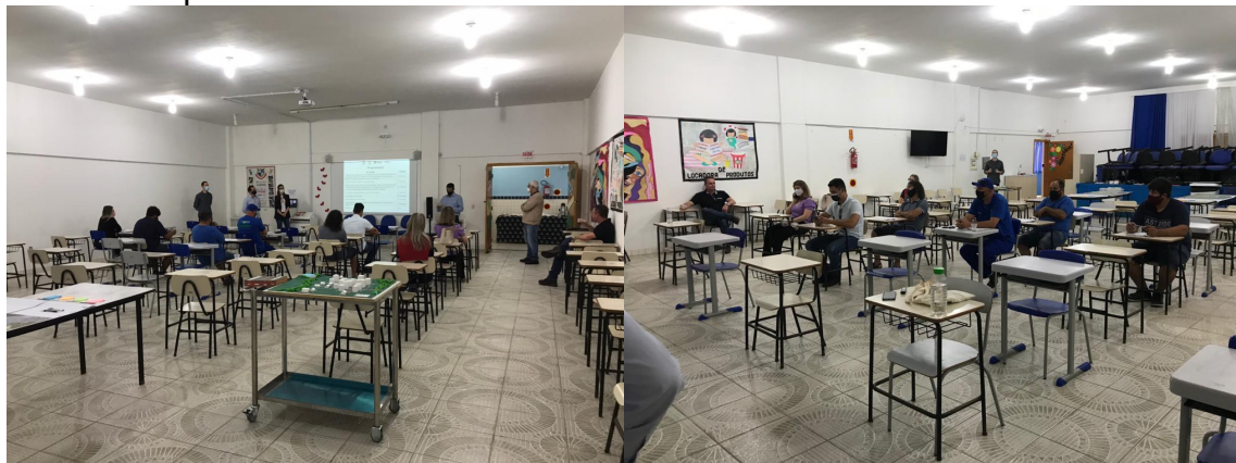
Figura 17 - Registros da segunda Reunião de Bairro em 10 de julho de 2021 na Escola Municipal Francisco Vitor Alves.