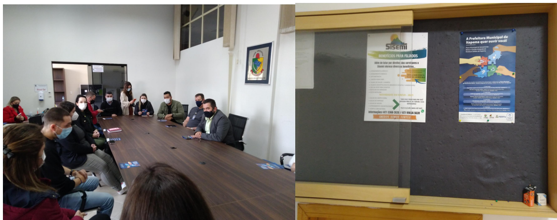
Figura 4 - Reunião com os vereadores na Câmara de Vereadores para divulgação das reuniões de bairro.

Foi também realizada uma reunião com os vereadores presentes na sala de reuniões na Câmara de Vereadores para divulgação e convite para a participação nas reuniões de bairro (Figura 4). Na ocasião, foram entregues 20 convites em mãos dos vereadores, e feita a colagem de um cartaz na recepção da Câmara de Vereadores. O Anexo I apresenta o registro de entrega da mobilização social para a participação social.