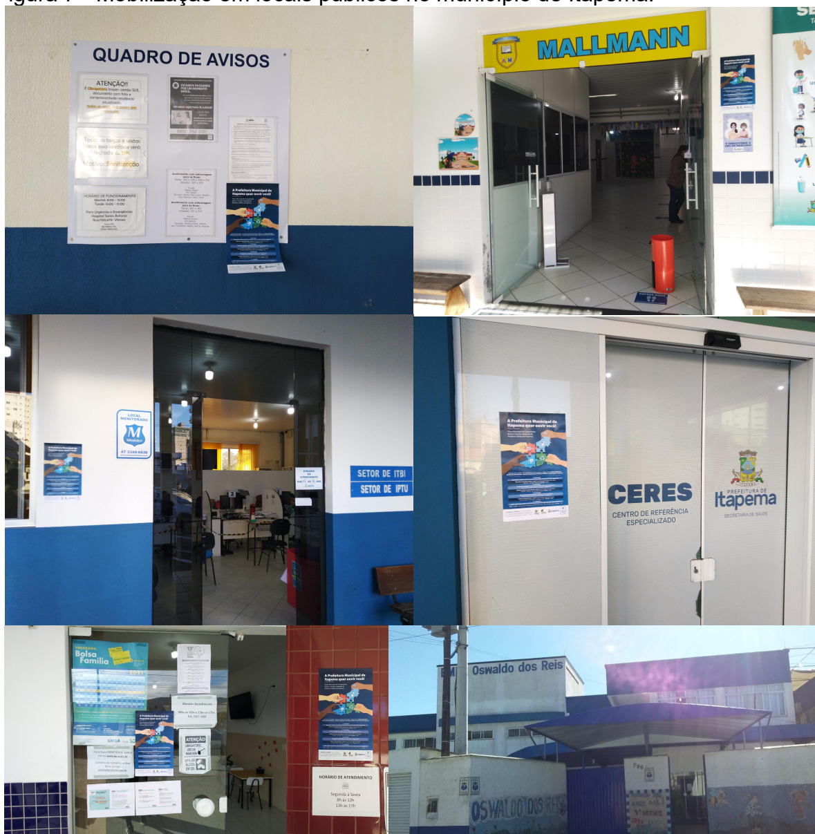
Figura 7 - Mobilização em locais públicos no município de Itapema.

central da sede da Prefeitura Municipal, na Secretaria de Planejamento Urbano, na Secretaria de Assistência Social e de Lazer, na Secretaria de Saúde, no Mercado Osmari, entre outros locais.