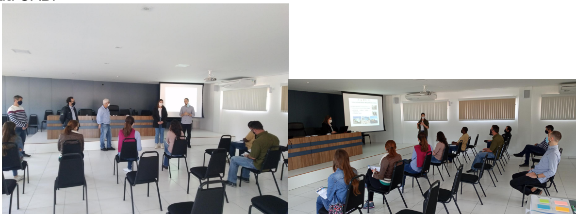
Figura 21 - Registros da quarta Reunião de Bairro em 24 de julho de 2021 na Sede da OAB.