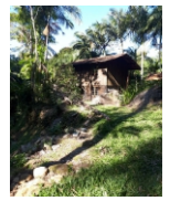
Mirante (Casa em Obras)