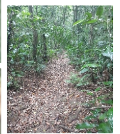
Vista da Trilha