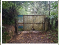
Portão de Acesso