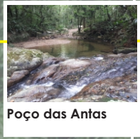
Poço das Antas