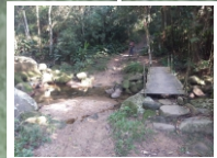
Ponte Sob o Rio São Paulinho