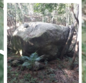
Atrativo Pedra Grande