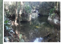
Poço da Anesga