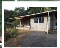
Casa de Apoio