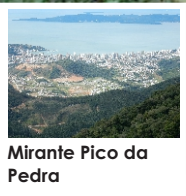
Mirante Pico da Pedra