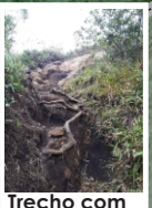
Trecho com forte declive