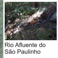
Rio Afluente do São Paulinho