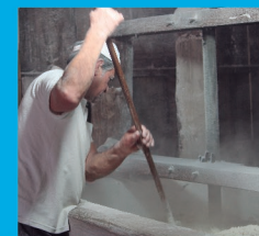
11 ENGENHO DE FARINHA Centenário Engenho no Sertão do Trombudo