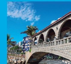
6 PONTE DOS SUSPIROS Entre a Praia Central e o Canto da Praia