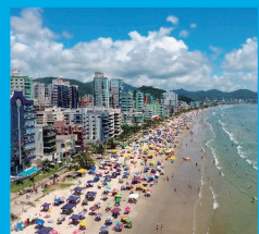
8 MEIA PRAIA A 4,5 km do Centro, sentido sul