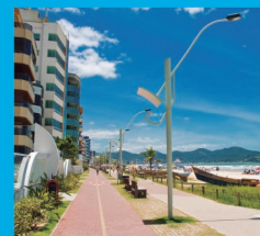
9 PARQUE CALÇADÃO Meia Praia, entre a Av. Nereu Ramos e a orla