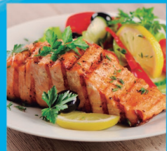
2 VIA GASTRONÔMICA Localizada na orla da Praia da Ilhota