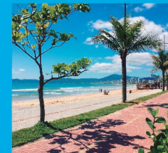
5 PRAIA CENTRAL Localizada no Centro de Itapema