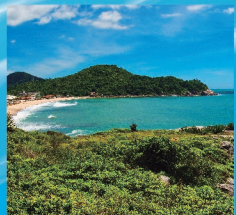
1 PRAIA DO ILHOTA A 5 km do Centro, sentido norte