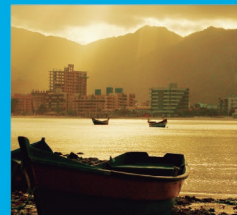
3 CANTO DA PRAIA A 2 km do Centro, ao norte da Praia Central