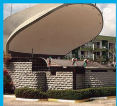
7 PRAÇA DA PAZ Av. Nereu Ramos, Centro de Itapema